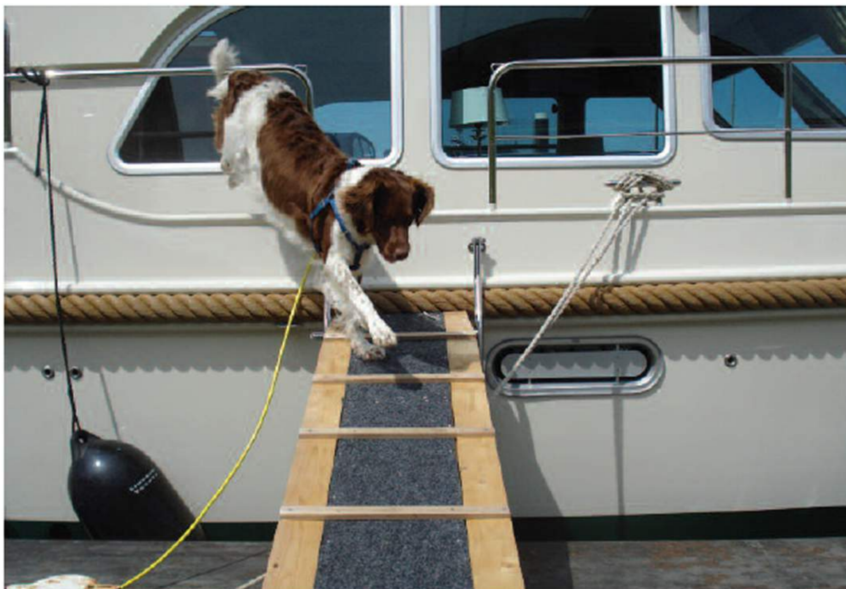
Ongewenst en onveilig gedrag.

Een hond kan niet begrijpen waarom hij in de ene situatie wél en in de andere situatie niet alleen van boord mag gaan. Het is daarom raadzaam een hond te leren om nooit zonder toestemming van boord te gaan.