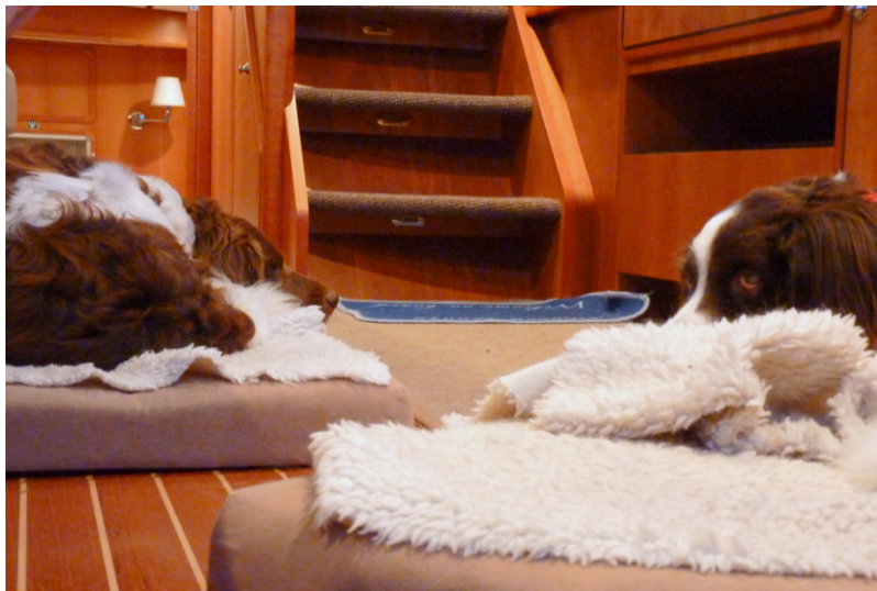
Foto: strook vloerbedekking op het loop- en slaapgedeelte en een met tapijt bekleed trapje. Voor de trap is kleef tape gebruikt zodat deze naar verwijdering onbeschadigd blijft.