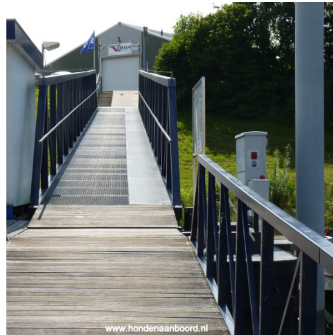
Een hondonvriendelijke en een hondvriendelijke rooster steiger/brug.